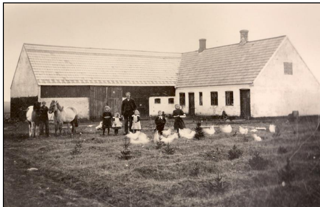
Gården "Nørmose" Nr. Mosevej 7 blev bygget i 1907.